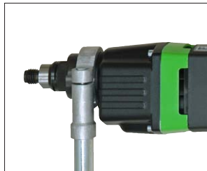
Verstellung für zuschaltbaren Softschlag Adjustment ring for switchable soft percussion