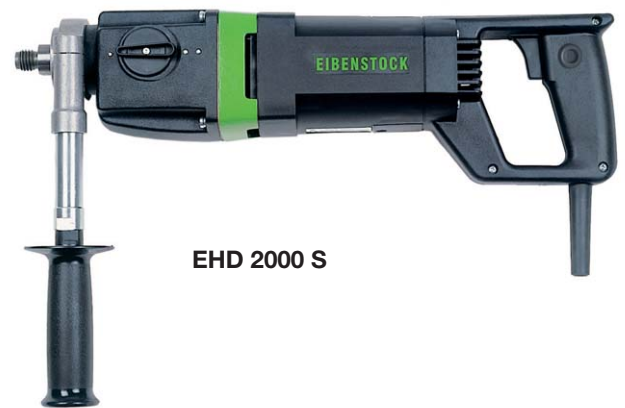
EHD 2000 S